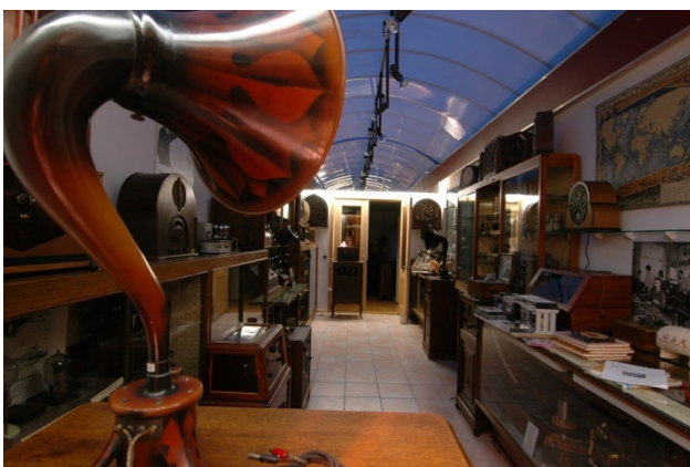
Een overzicht van de fabrieksontvangers

Onze bibliotheek met 50 meter radioliteratuur uit de periode van circa 1850 tot 1980 is een rijke bron van informatie.