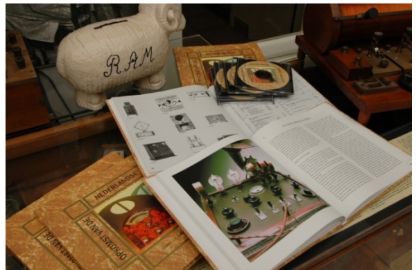
Ons boekwerk 'Opkomst van de Nederlandse Radio Industrie 1915 - 1933' (2002). Verkrijgbaar in ons museum

Na de oprichting van Stichting "Het Radio Amateur Museum" in 1985 hebben wij op bovengenoemd gebied baanbrekend onderzoek gedaan. Dit resulteerde in een boekwerk waarin ruim 450 Nederlandse radioproducenten staan vermeldt, goed voor ongeveer 2500 modellen! De informatie is gehaald uit onze bibliotheek