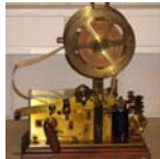
De sTEN informatie folder

De sTEN stelt zich kort samengevat tot doel de deelnemers te ondersteunen bij het behouden/beheren, documenteren en toegankelijk maken van het telecommunicatie erfgoed in Nederland. Dit door bevorderen, ondersteunen en borgen van door de deelnemers behoorde collecties, zodat de kennis en kunde inzake het beheer van telecom erfgoed behouden blijft en doorgegeven kan worden aan volgende generaties.