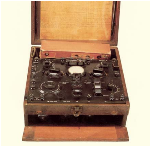
De Engelse Wireless Trench Set MK II uit 1917 voor toepassing in de loopgraven. De eerste zend/ontvanger ter wereld met toepassing van radiolampen.

Het is daarom dat, door deze culturele vrijheid in Nederland het radioamateurisme een enorme vlucht nam en het verklaart tevens de naamgeving van ons museum: het Radio Amateur Museum! Op ruim 150 m2 vindt u daar: