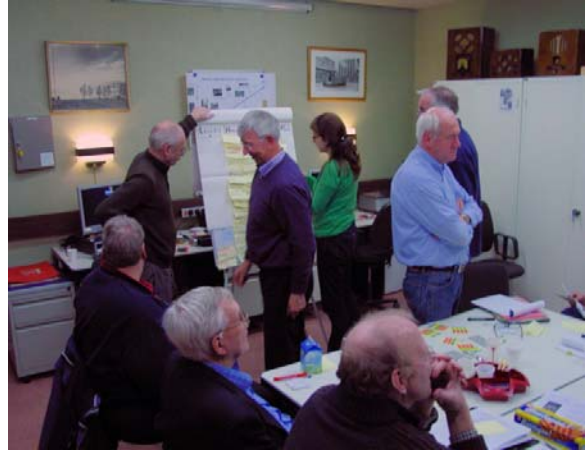
De sTEN in actie

Aanmelden als supporter of deelnemer kan via onze website.